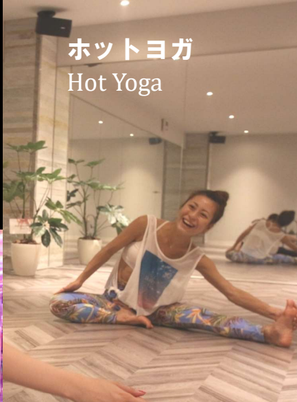
ホットヨガ Hot Yoga