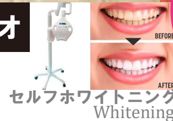
セルフホワイトニング Whitening