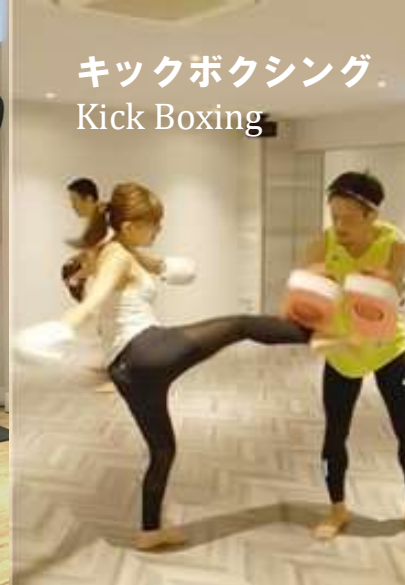
キックボクシング Kick Boxing