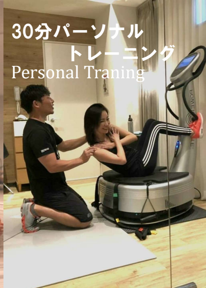
30分パーソナル トレーニング Personal Training